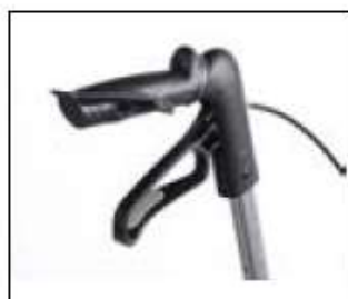
// 9012281 (4) Poignées longues, avec graduation