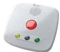
Appareil de Téléassistance