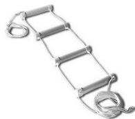
Echelle de lit Homecraft