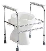
Cadre de toilette C407a Invacare