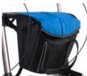
// 9012319 (1) Sac, avec clips de fixation, bleu/noir