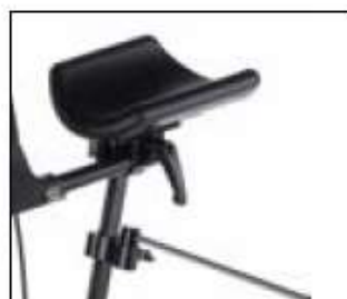
// 9011992 & 9011988 Barre de stabilisation

(2) Incompatible avec 60/60 M & Gemini 60/60 M Walker.