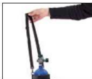
// 7109050 & 7109051 Panier porte-bouteille oxygène