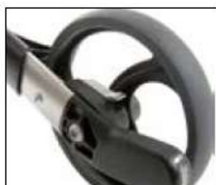
// 7109080 Frein ralentisseur