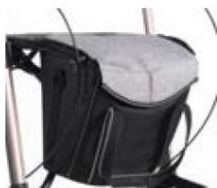
// 9012316 (1) Sac, avec clips de fixation, graphite/noir