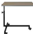
Table de malade

Hauteur réglable 66-98 cm Roulettes doubles avec stop Charge maximale 20 kg