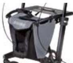
// 7104025 (1) Sac à rabat avec poignée et bandoulière, gris/noir