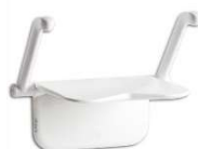
Siège de douche mural Relax Etac