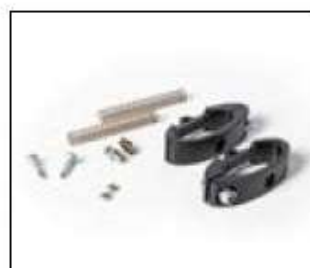
// 9011971 Freinage inversé