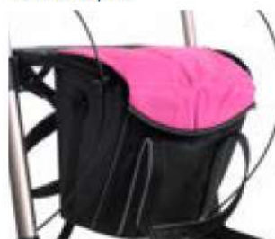
// 9012321 (1) Sac, avec clips de fixation, rose/noir