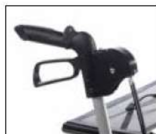
// 9012049 (2) Freinage à une main (utilisable des deux côtés)