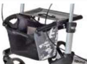
// 7104035 Panier, impression gris/noir