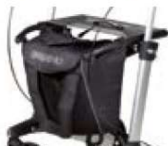
// 7104006 (1) Sac à rabat avec poignée et bandoulière, noir/noir