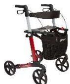
Rollator Leopard M Rouge - Noir Hauteur poignées : 74-102 cm Hauteur d'assise : 62 cm Largeur d'assise : 46 cm Poids 6. 2 kg, Charge max : 150 kg