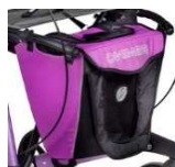
Sac City, avec poignée et rabat pour Rollator Gemino