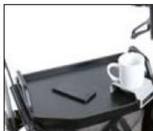
// 7109140 Tablette