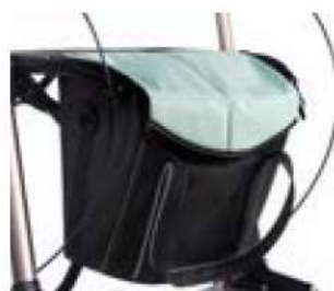
// 9012317 (1) Sac, avec clips de fixation, vert menthe/noir