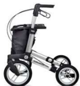
Rollator Gemino 60 tout terrain Hauteur poignée: 76-95 cm Largeur: 64 cm, Hauteur assise: 62 cm Poids max.: 150 kg, Poids: 8.5 kg