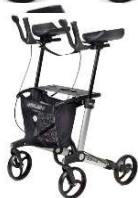
Rollator Gemino 30 Walker Avec appui avant-bras Hauteur totale: 98-115 cm Largeur: 61 cm, Hauteur assise: 62 cm Poids max.: 150 kg, Poids: 10.6 kg