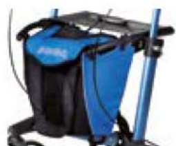
// 7104022 (1) Sac à rabat avec poignée et bandoulière, bleu/noir