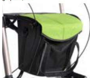
// 9012320 (1) Sac, avec clips de fixation, vert/noir