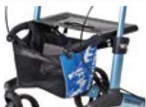
// 7104032 Panier, impression bleu/noir