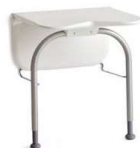
Siège de douche mural Relax Etac