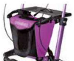
// 7104023 (1) Sac à rabat avec poignée et bandoulière, rose/noir