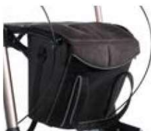
// 9012315 (1) Sac, avec clips de fixation, Alcantara/noir