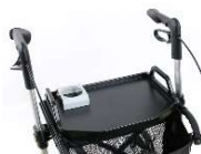
Tablette avec support verre pour rollator Gemino 30/30M