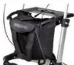
// 7104007 (1) Sac à rabat avec poignée et bandoulière, noir/noir