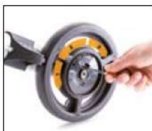
// 9009329 Speedcontrol

Sous réserve de modifications sans préavis, de fautes d'impression et d'erreurs.