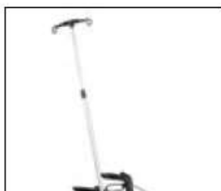
// 7109100 Porte-perfusion