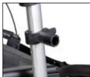
// 7109090 Support de fixation universel