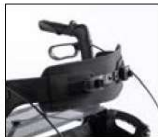
// 9012222 (3) Dossier confort