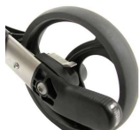
Frein ralentisseur pour Rollator Gemino