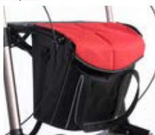
// 9012318 (1) Sac, avec clips de fixation, rouge/noir