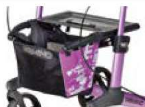
// 7104033 Panier, impression rose/noir