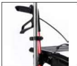
// 7109011 Porte-béquille