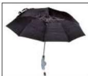
// 7109060 Parapluie, noir