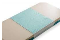
Protection de matelas Comfot Safe