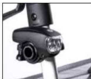
// 7109095 Eclairage