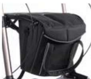
// 9012314 (1) Sac, avec clips de fixation, noir/noir