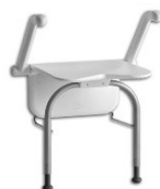
Siège de douche mural Relax Etac