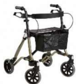
Rollator Taima M Eco Hauteur siège: 62 cm Largeur d'assise: 42 cm Charge max.: 150 kg Soutien dorsal, Porte-canne