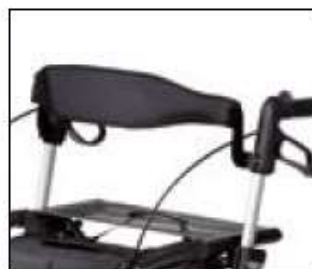
// 9012220 & 9012221 (2)(3) Dossier