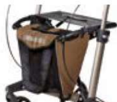
// 7104024 (1) Sac à rabat avec poignée et bandoulière, brun/noir