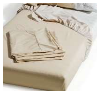
Housse Protège-matelas 90x200x20

Tissu polyamide revêtu de polyuréthane 160 g/m2 résistant aux liquides organiques léger, souple et respirant