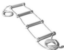
Echelle de lit Homecraft