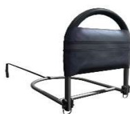
Poignée de lit pliable ADV-TRAVELER