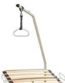
Potence pour lit Belluno Bett in Bett