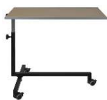
Table de malade Hauteur réglable 66-98 cm Roulettes doubles avec stop Charge maximale 20 kg