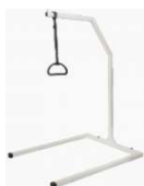
Potence sur pied Hauteur fixe